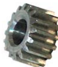
行星小齿轮用的直齿圆柱齿轮